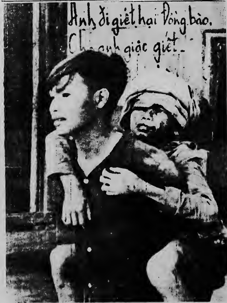
Un mucha Vietnamita ta carga su lumba menor riba su lomba después cu e muchanan aki a keda atrapá entre tiramentu comunista contra mericanon qu tabata ehecutando "Operation Eagle's Claw". Tras di e muchanan por mira poco lema Viet Cong.

E fisico famoso aqui, ultimamente a ser rehabilita pa comision di energia atomica a hanja oferta pa biba den un residencia banda dje instituto cual construccion tabata disponi pa direccion dje establecimiento como simbolo di nan afecto y gratitud.